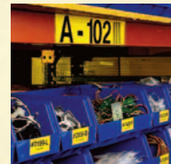
Identificação de Compartimentos e Prateleiras