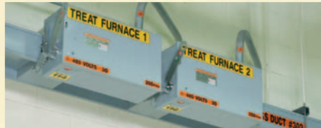
Identificador de Condutor Geral/Duto