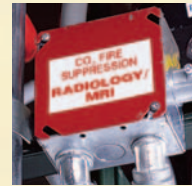
Gaixas de Distribuição