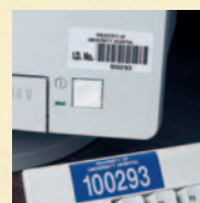
Identificação de Ativos