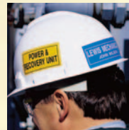
Identificação de Pessoal