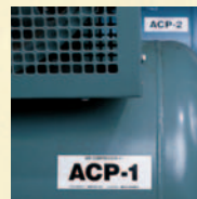
Identificação de Equipamento